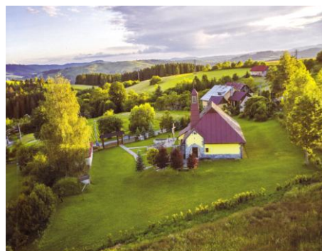
Závršie – pole preorané